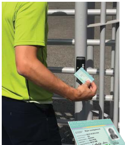
Vi kan levere grinden med ferdig påsatt lesere for registrering av byggekort. Enkelt og komplett IT-system for mannskapskontroll.