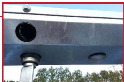
I taket på grinden er det lys, samt lys for retningsanvisning.