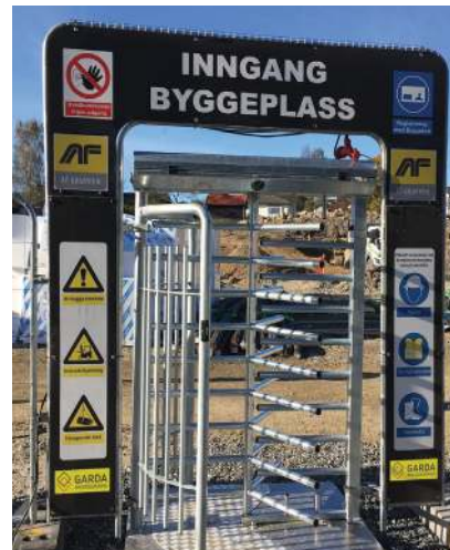
Ved å benytte en inngangsportal får du et tydelig inngangsparti der du kan velge den varslingen du ønsker og med din logo på rammen.

Størst på mobile sikringssystemer i hele Norge!